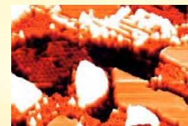
STMで観察した Er/Si(111) の表面構造

STM image of several reconstructions of Er/Si (111)